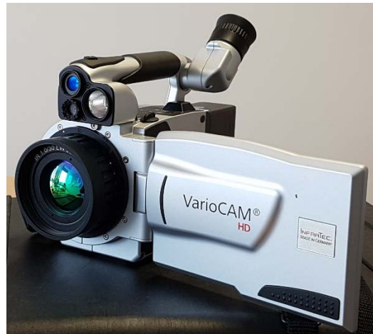
Wärmebildkamera VarioCAM HD 700